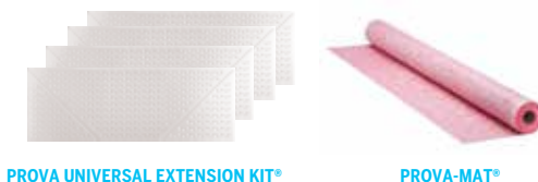
PROVA UNIVERSAL EXTENSION KIT®