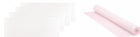
PROVA UNIVERSAL EXTENSION KIT®