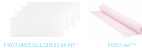
PROVA UNIVERSAL EXTENSION KIT®